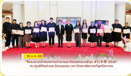
16 ม.ค. 69 "โครงการนิทรรศการภาษาและวัฒนธรรมญี่ปุ่น #日本祭 2026" ณ ศูนย์ศิลปะและวัฒนธรรม มหาวิทยาลัยราชภัฏศรีสะเกษ