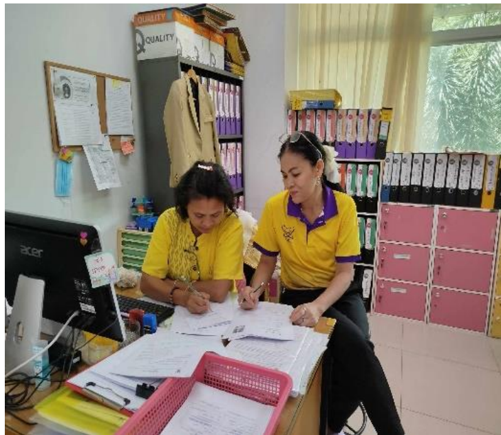
ภาพกิจกรรมโครงการ โครงการคลินิกความก้าวหน้าของบุคลากรสายสนับสนุน (เพื่อนช่วยเพื่อน)