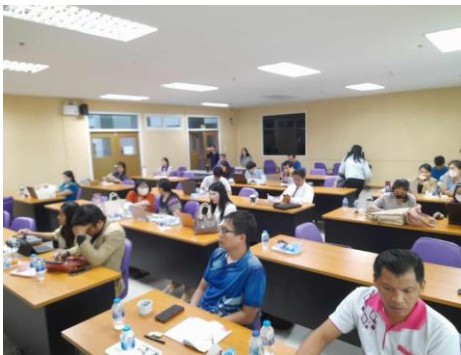
ภาพกิจกรรม โครงการฝึกอบรมเชิงปฏิบัติการเพื่อเพิ่มประสิทธิภาพการบริหารงบประมาณ พ.ศ. ๒๕๖๗